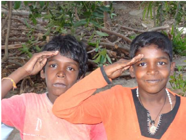
Een groet van de kinderen

Nieuwsbrief voor de Vriendenkring van Stichting Thiru Valagum Farm Ten dienste van Thiru Valagum Farm Project in India