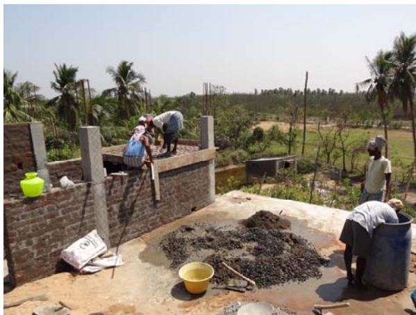
Tweede verdieping Thiru Valagum House. Beneden het eendenhuis bij de visvijver.