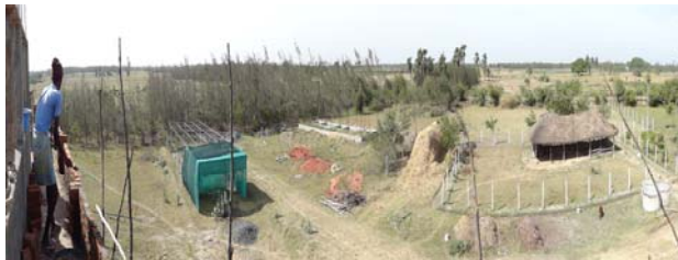
Zicht na de cycloon vanaf de nieuwbouw over de boerderij.

Francois Impens, Peningmeester, 2 e Secretaris Stichting Thiru Valagum Farm .