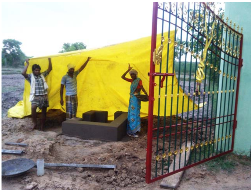
Constructie bezinkputten afvoer overtollig regenwater